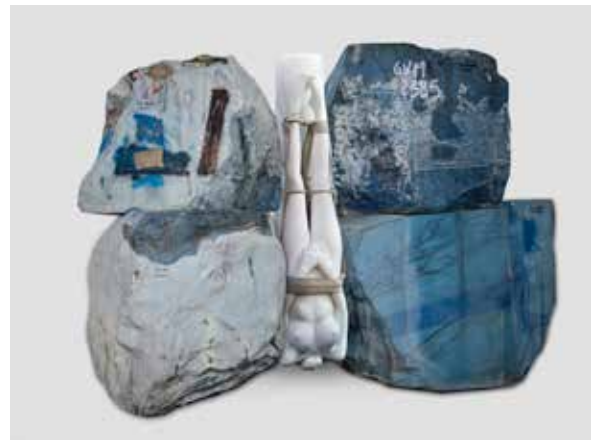
"Jennifer Statuario" Padiglione Italia Expo 2015 "Jennifer Statuario" 2015 Expo - Italy Pavilion

Il Padiglione Italia dell'appena inaugurato Expo 2015 presenta un'opera realizzata da Robot City-Italian Art Factory : l'azienda guidata da Gualtiero Vanelli ha infatti collaborato con l'artista italiana Vanessa Beecroft per la realizzazione di una scultura commissionata appositamente per il Padiglione Italia. La Beecroft , artista fra le più note nel panorama internazionale, ha realizzato per il padiglione nazionale " Jennifer Statuario ", un'opera che si compone di due sculture, entrambe ricavate dal calco dal vero della sorella dell'artista, e quattro blocchi di cava di marmo rivestiti di cera blu. Lo stile in cui la figura è stata realizzata è quello classico figurativo. I seni, le mani e i piedi originali della figura sono stati sostituiti da piedi, mani e seni in onice bianco venato semitrasparente, più vicini al modello originale e all'idea dell'artista, un'operazione simile a quella del collage realizzata poco prima di questa esposizione.