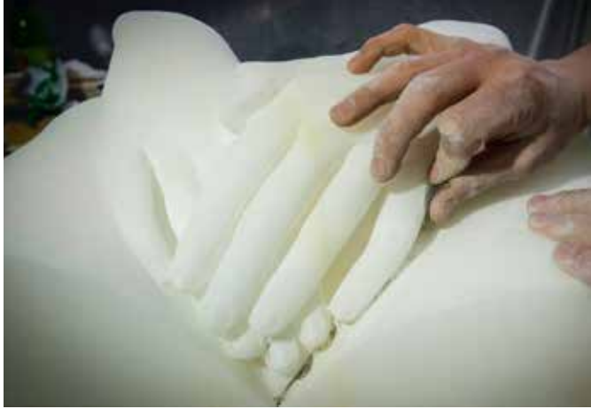
"Jennifer Statuario" dettaglio "Jennifer Statuario" detail