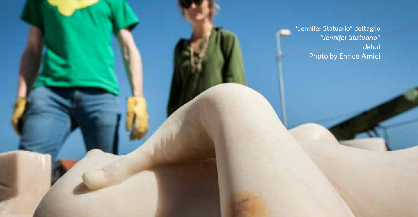
"Jennifer Statuario" dettaglio "Jennifer Statuario" detail