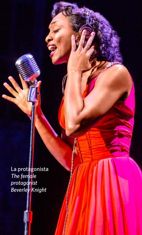
La protagonista The female protagonist Beverley Knight